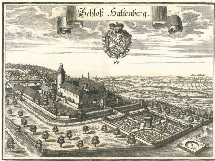
Die Burganlage in einem Stich von Michael Wening 1701

Sie ist die einzige erhaltene Burgruine am gesamten Lechrain zwischen Donauwörth und Füssen. Zudem ist die Burgruine Haltenberg in der Region ein beliebtes Ausflugsziel und umgeben von Fahrrad- und Wanderwegen.